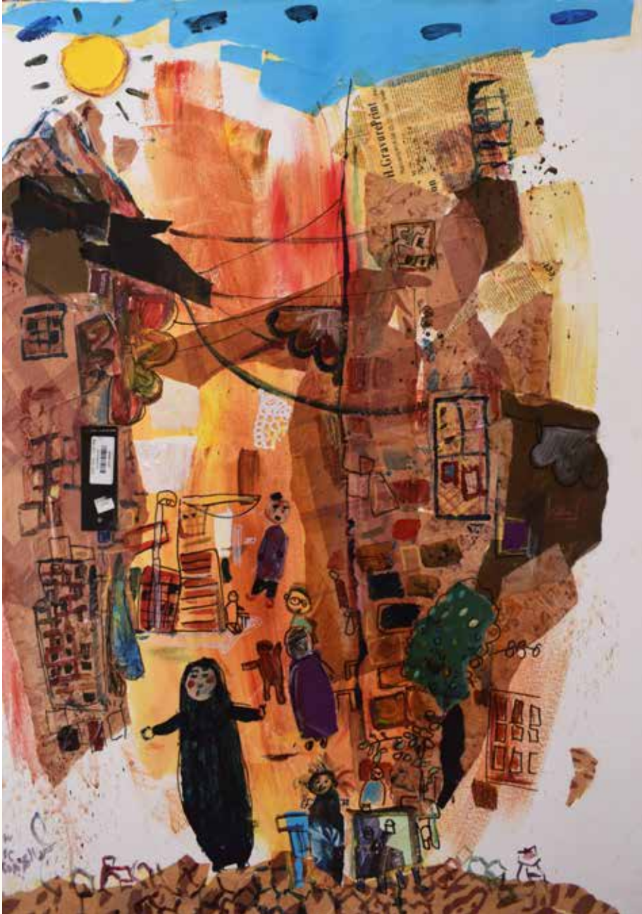
70×100 سم - أكريليك - 2025