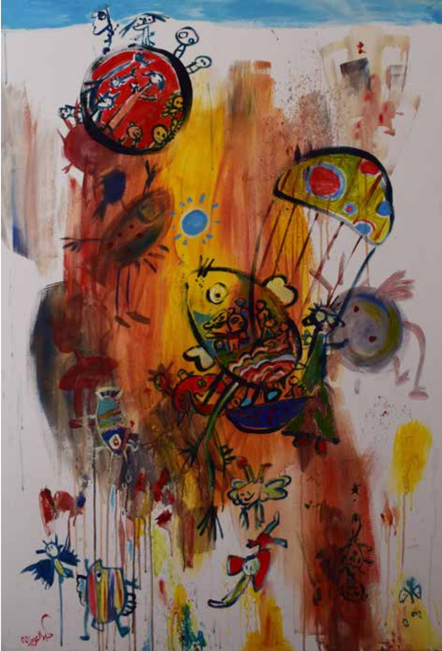
150×100 سم - أكريليك - 2025