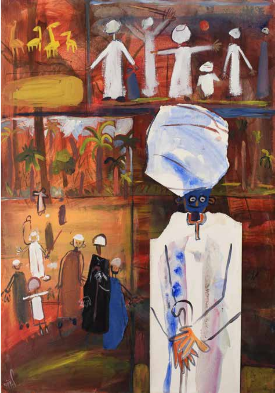
2024 - خامات مختلطة - 80×60 سم