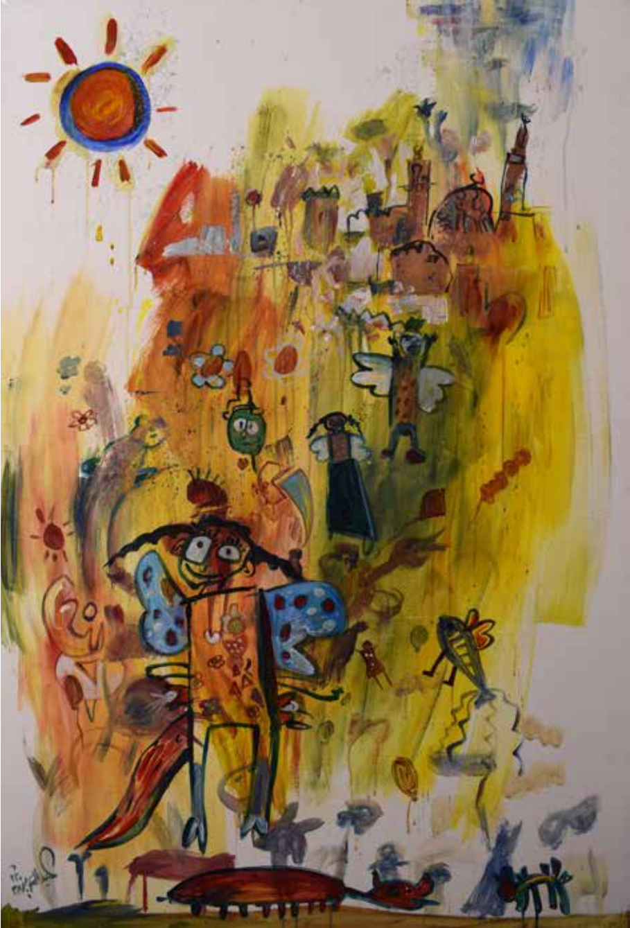
150×100 سم - أكريليك - 2025