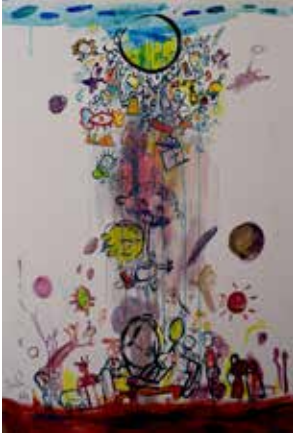
2025 - أكريليك - سم - 150×100