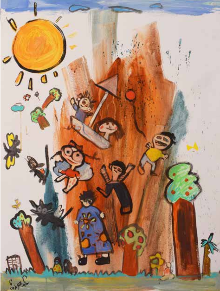
80×60 سم - أكريليك - 2025