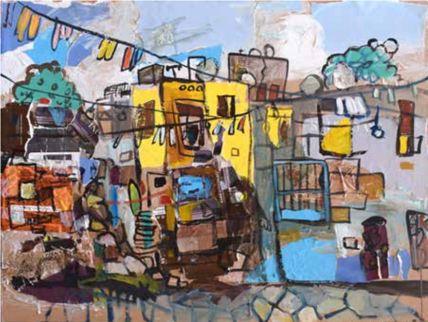
80×60 سم - خامات مختلطة - 2025