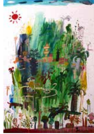
2026 - أكريليك - سم - 70×100