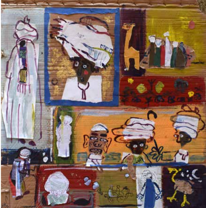
2024 - خامات مختلطة - سم - 78×75