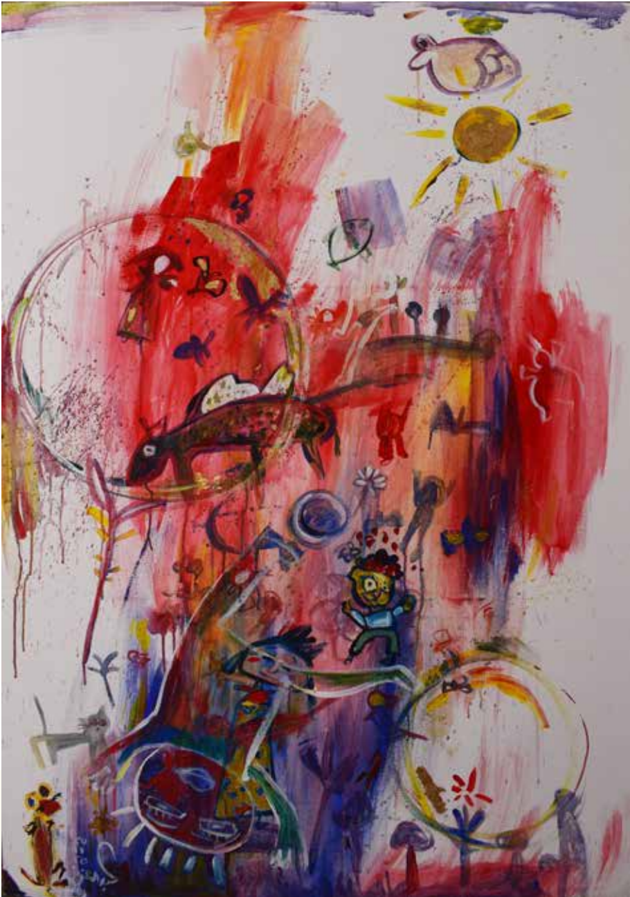
2025 - أكريليك - سم - 150×100