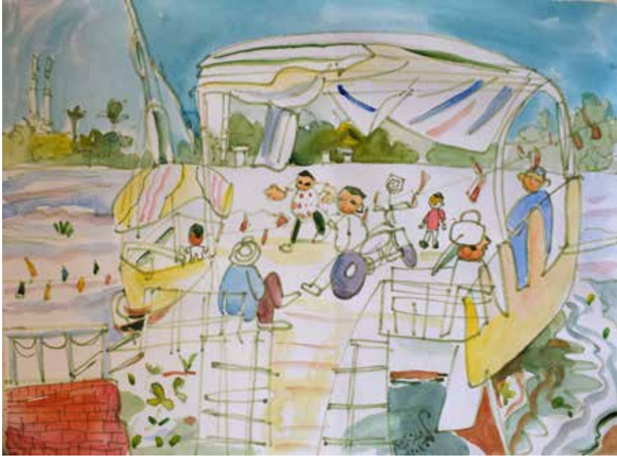
46×33 سم - ألوان مائية وفلوماستر - 2025