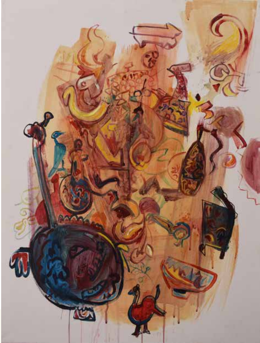
70×100 سم - أكريليك - 2025