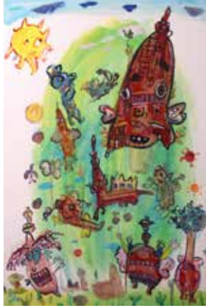
2025 - أكريليك - سم - 70×100